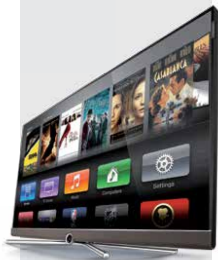
Connect 55 UHD/DR+ en cappuccino