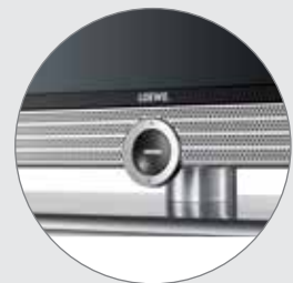
Pied en aluminium anodisé