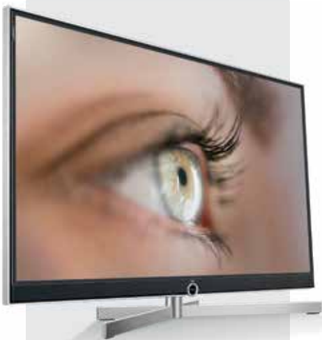
Reference 55 UHD avec Table Stand

Son cristallin – La barre de son intégrée offre une expérience sonore à la fois renversante, authentique et naturelle. Huit haut-parleurs permettent de reproduire avec la plus grande précision même les sons les plus complexes. Malgré ses lignes élancées, la barre