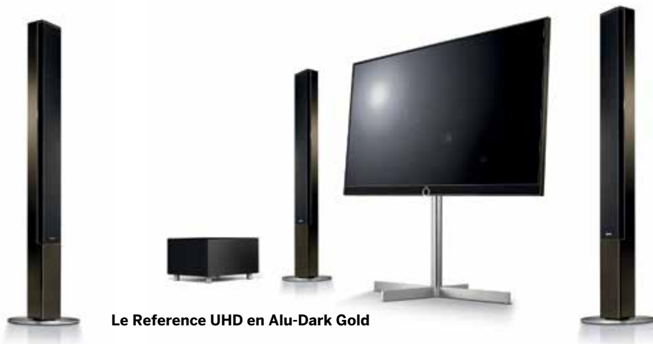
Le Reference UHD en Alu-Dark Gold

de son renferme des technologies sophistiquées et novatrices pour des performances inégalées. L'enceinte stéréo de qualité supérieure, orientée vers le téléspectateur, délivre une puissance musicale de 2x60 watts en mode bass-reflex. Vous profitez donc d'un son 3D virtuel cristallin sans avoir à installer des haut-parleurs externes supplémentaires. Rien d'étonnant de la part de Loewe.