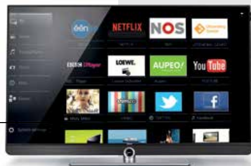
Art 40 UHD en alu-black

A l'achat d'un Loewe Art UHD 40, 48 ou 55 vous recevrez un Apple TV gratuit avec Netflix app inclus.