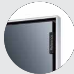
Cadre en aluminium anodisé 4 mm

Le Loewe Reference est également disponibles en tailles XXL 75 inch (191 cm) et 85 inch (216 cm). Ces produits sont exclusivement disponibles auprès de votre Loewe gallery ou Loewe Reference Partner.