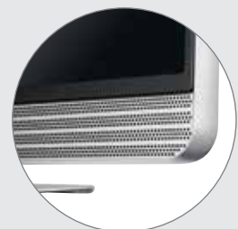
Barre son intégrée, jusqu'à 80 W

Envoyez de la musique, des photos et des vidéos depuis votre smartphone ou votre tablette vers votre téléviseur et profitez d'un confort exceptionnel et d'une qualité sans pareil.