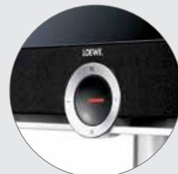
Barre son intégrée d'une puissance de 120 watts, avec 8 haut-parleurs