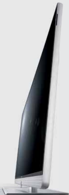
Art 40 UHD en alu-silver

Nos smartphones et nos tablettes débordent de musiques, de photos et de vidéos. Et si vous les partagez en bénéficiant de la qualité d'image et de l'acoustique excellentes dont vous disposez chez vous ?