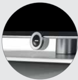
Pied en aluminium