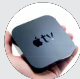
Maintenant avec un Apple TV gratuit pour accès Netflix.