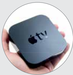
Maintenant avec un Apple TV gratuit pour accès Netflix.