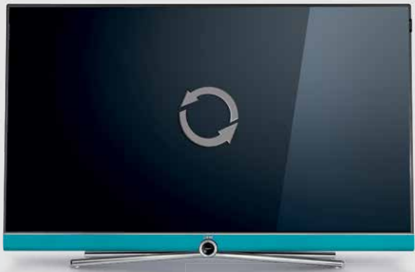
Feature Upgrade Drive