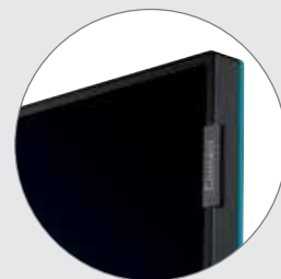
Cadre en aluminium anodisé

Stand Speaker en argenté ou noir : € 1.500 (paire)