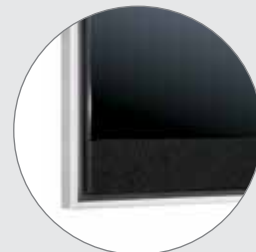
Vitre filtre amplificatrice de contraste