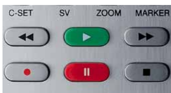
Opname-bedieningsknoppen op uw Loewe-afstandsbediening

Zo kunt u bijvoorbeeld tot ruim 350 uur in HD televisiekijken. De Loewe Individual bijvoorbeeld beschikt over een geïntegreerde harde schijf die met 750 GB ruimte biedt voor maar liefst 350 uur film. En dat in SD-, HD- of 3D-kwaliteit. Zo staat uw filmverzameling vanaf nu niet meer in de kast of opgeslagen op een externe harde schijf, maar bevindt deze zich waar u ze nodig heeft: in uw