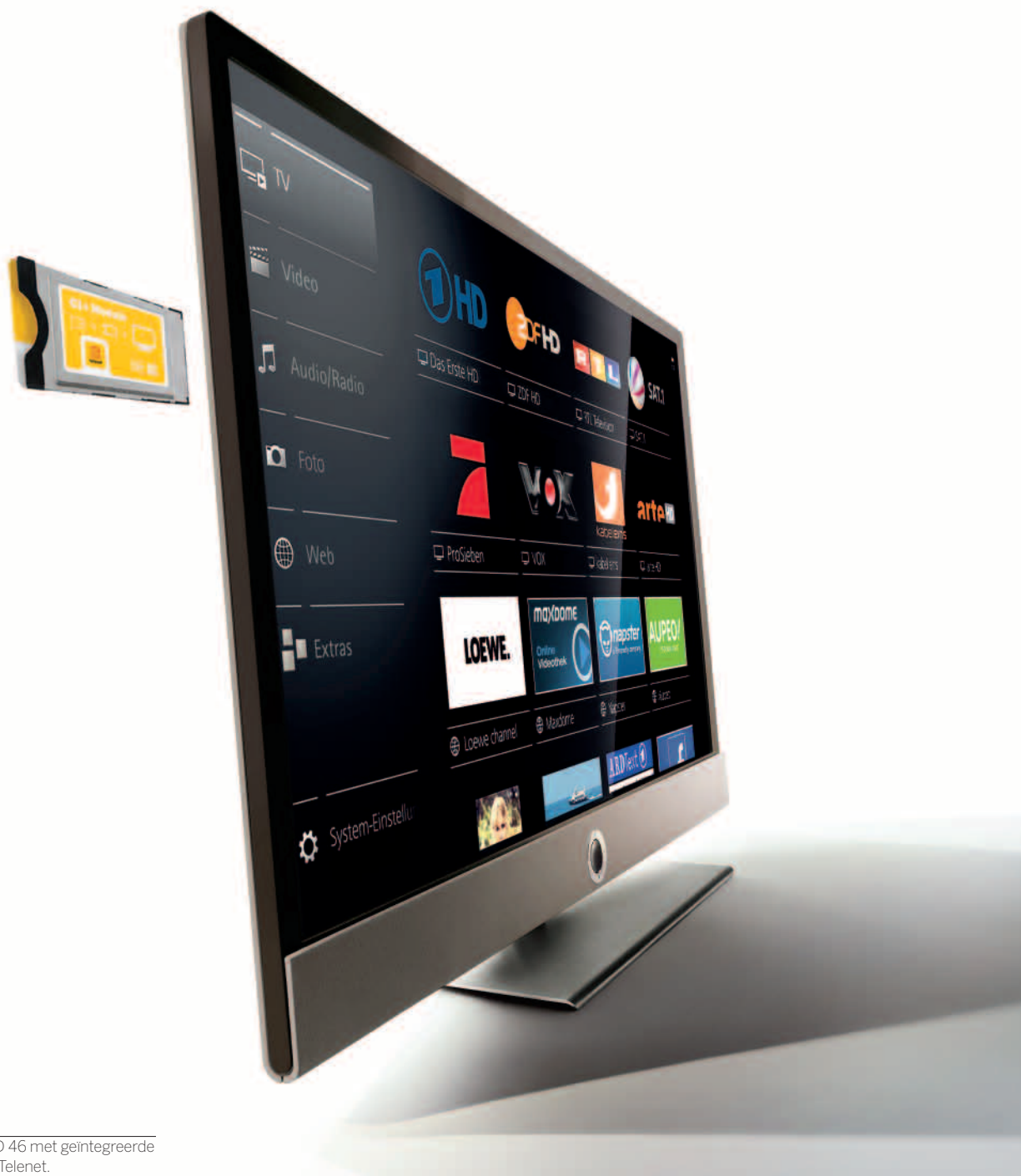
Loewe Connect ID 46 met geïntegreerde minidecoder van Telenet.